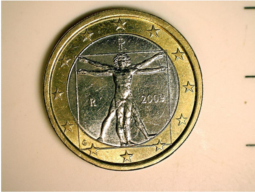
Moneta da 1 Euro, illuminazione laterale con faretto