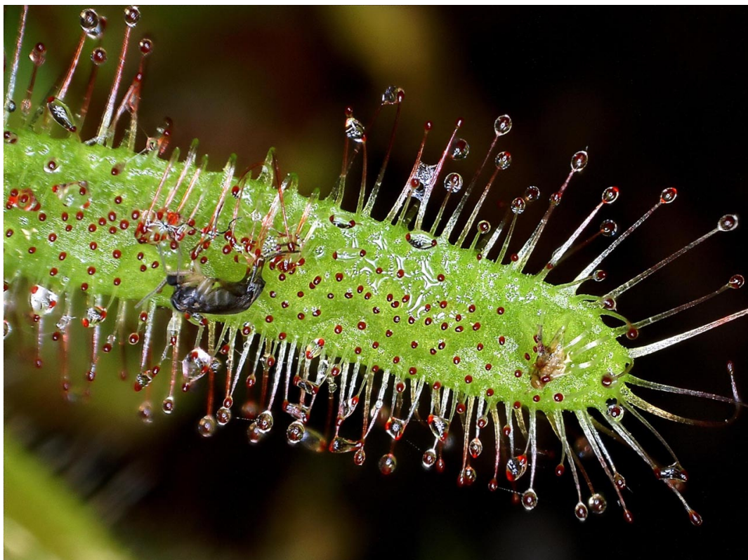
Foglia di Drosera con insetti catturati, luce interna a corona di led (nota il riflesso nelle gocce)