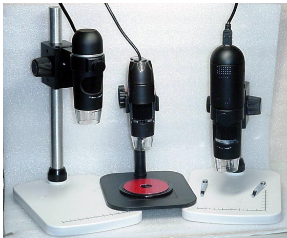
Da sin.: 5Mpx, 1,3 Mpx e 5Mpx WiFi

In genere hanno anche alcune caratteristiche che li identificano: al posto della base rotonda, hanno un piccolo stativo con mini colonna e cremagliera. Inoltre, il loro programma di gestione prevede sempre la misurazione digitale ed, a corredo, hanno un semplice ruler di plastica per la taratura. Il loro costo a nuovo è in genere sui 50/70 Euro, ma gli stessi identici modelli li potete trovare anche a 30 Euro. Il motivo è che il costo di produzione è veramente esiguo, per cui il margine di guadagno è variabilissimo e consente diverse politiche di vendita.