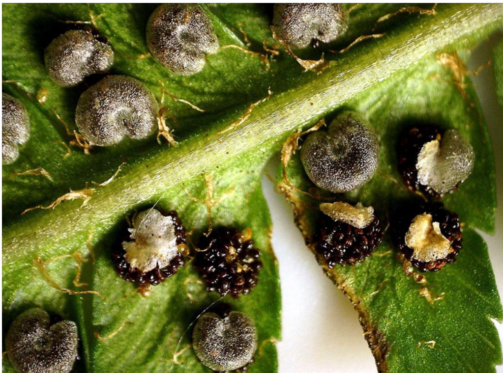
Sori di Felce comune, illuminazione a corona di led