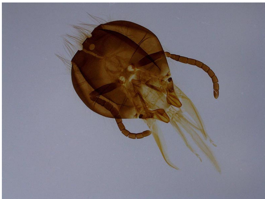
Testa di ape, illuminata per trasparenza (con rimbalzo della luce sulla base bianca del tavolino)

Esempi di immagini ottenute con un micro da 1,3 Mpx reali.