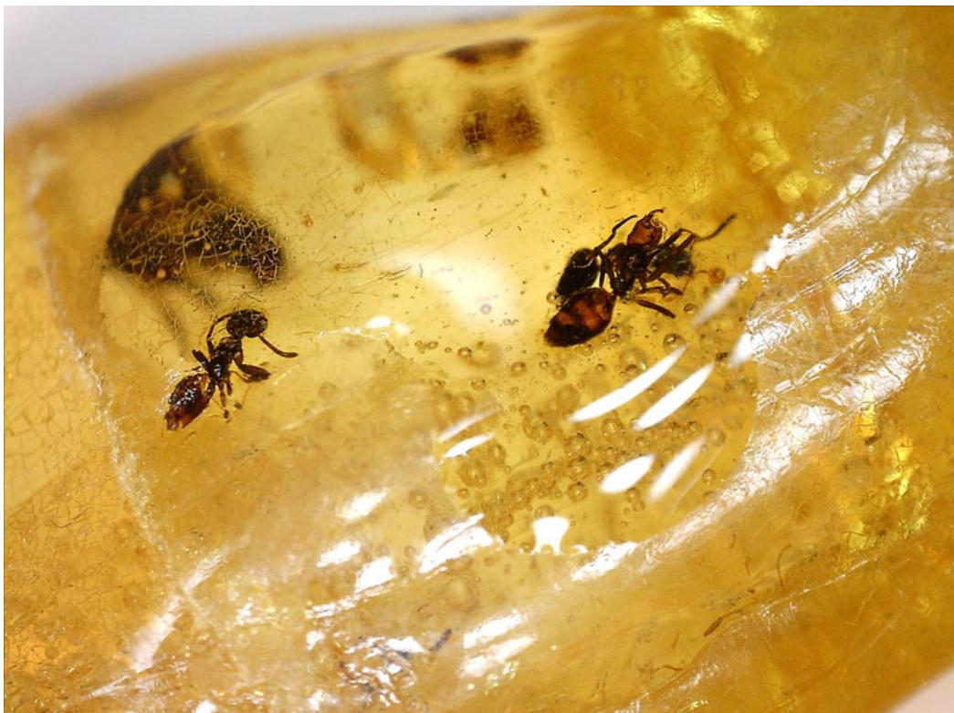
Copale fossile con formiche intrappolate nella resina, illuminazione laterale con faretti