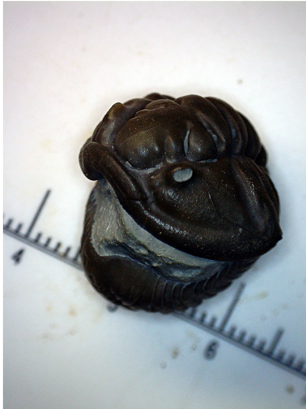
Trilobite fossilizzata in posizione di difesa, illuminazione a corona di led